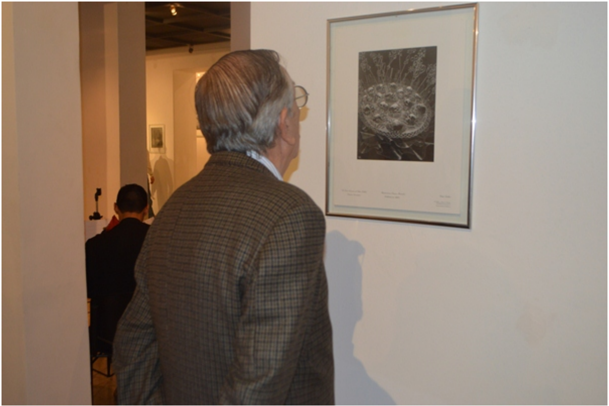
Asistentes admirando la obra del xilógrafo Victor Delhez