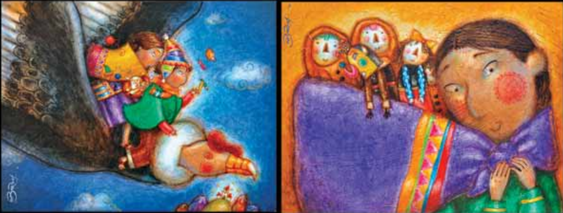
(Miguel Ángel Burgoa Valdivia es un pintor reconocido, experto ilustrador de láminas educativas e incansable peregrino de la paz. Actualmente trabaja contra reloj las imágenes de las conocidas tarjetas de Aldeas SOS)