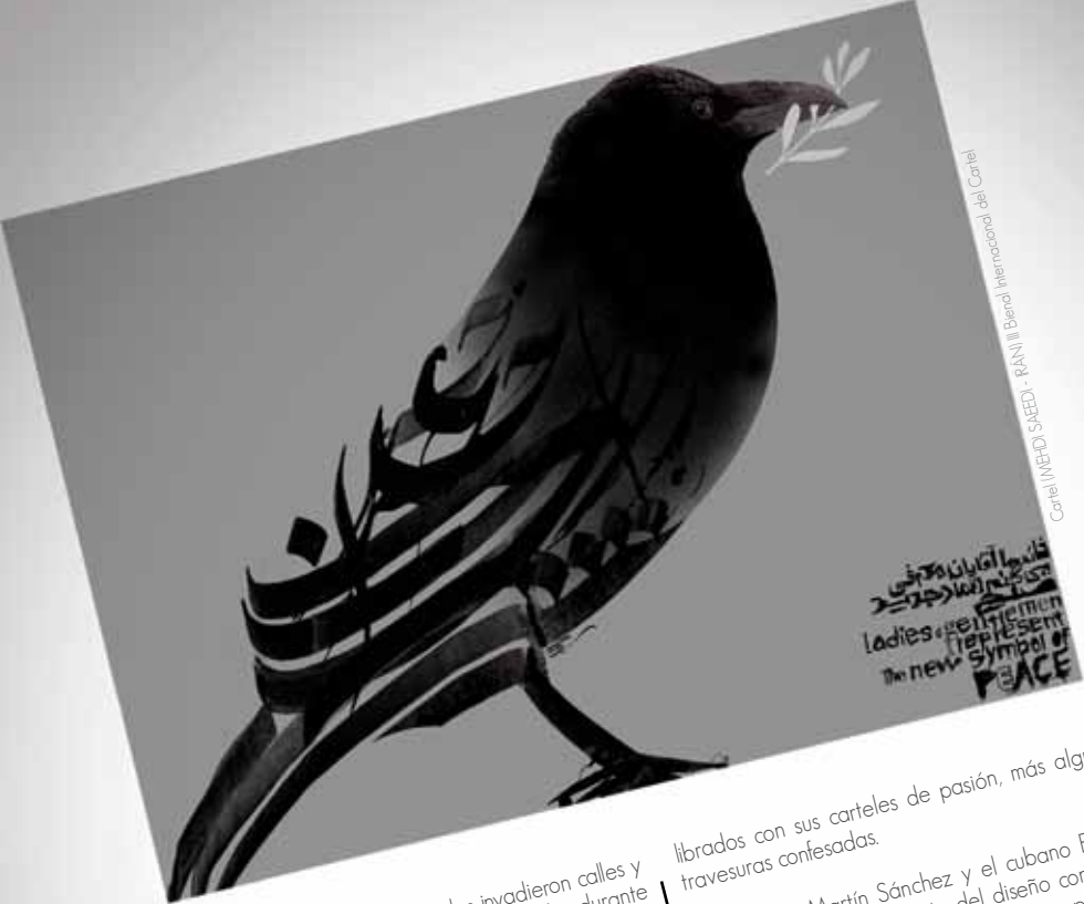
Cartel (MEHDI SAEEDI) - RANJ II Bienal Internacional del Cartel

El arte y el diseño profesionales invadieron calles y paredes, salas, museos y centros culturales durante los meses de octubre y noviembre últimos, completando el calendario del quehacer cultural de La Paz.