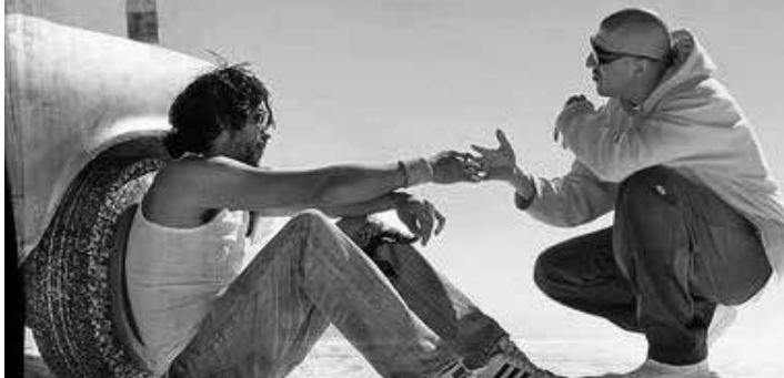
EL OLOR DE TU AUSENCIA

La Unidad Municipal del Adulto Mayor y Personas con Discapacidad auspicia la proyección de películas con lenguaje de señas y un concierto que estrenará el disco de la agrupación de jóvenes con discapacidad. Ref. 2440709.