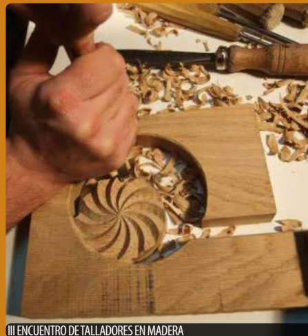
III ENCUENTRO DE TALLADORES EN MADERA