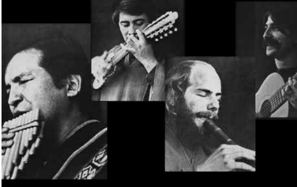
TRIBUTO A LOS JAIRAS

de la música boliviana, décadas del '60 al '80, ofrecerán un inolvidable concierto de variados ritmos. Una cita infaltable. Ref. 2713868.