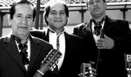
SINDICATO BOLIVIANO DE ARTISTAS EN VARIEDADES