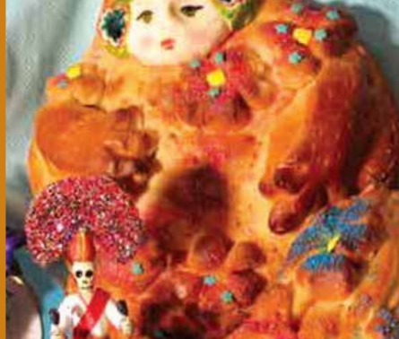
MESAS RITUALES MEXICO - BOLIVIA

El público podrá adquirir obras del Concurso de Suma Lurata "Forjando Identidades". Museo Tambo Quirquincho.