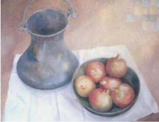
Título: Bodegón sobre Wiphala Técnica: Oleo