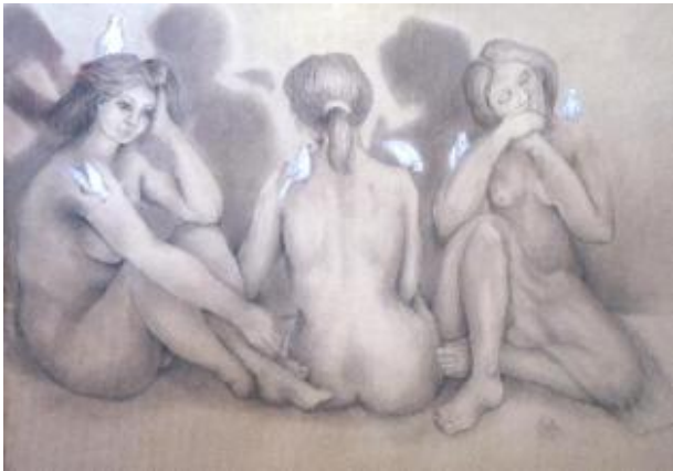
Titulo: Capricho surrealista Técnica: Dibujo