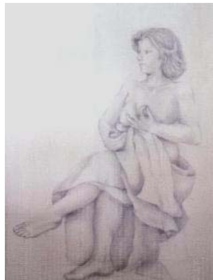
Título: Estudio de figura y pliegue Técnica: Dibujo