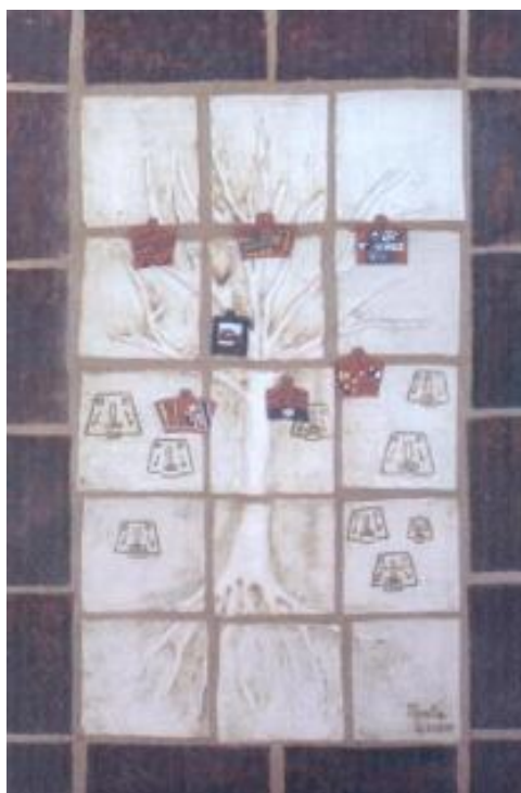
Título: Defensa de bosque Técnica: Cerámica (mural)