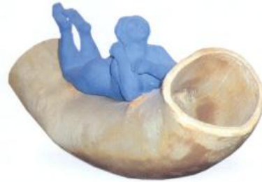
Titulo: Mujer Técnica: Escultura