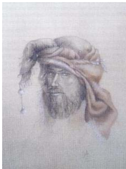
Título: Rostro Técnica: Dibujo