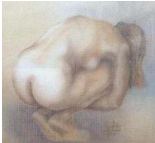
Título: Estudio de figura II Técnica: Dibujo (Sanguina)