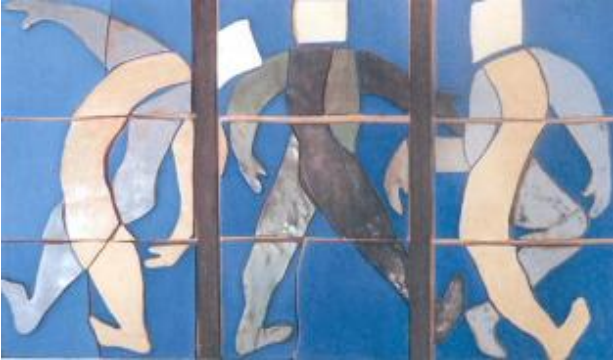
Titulo: Pepinos Técnica: Cerámica