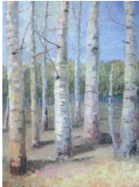
Titulo: Bosque de abedules Técnica: Óleo