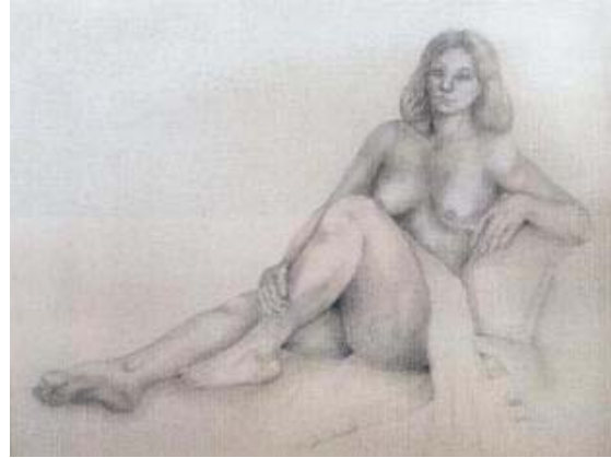
Título: Estudio de Figura I Técnica: Dibujo