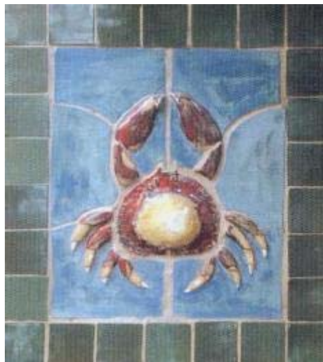
Título: Signo Cáncer Técnica: Cerámica (bajo relieve)