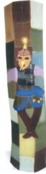
Título: Vaso y Kusillo Técnica: Cerámica