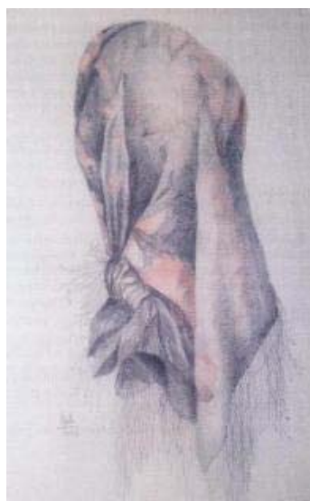
Título: Pañoleta Técnica: Dibujo