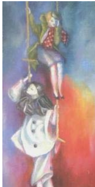
Título: Arlequín y colombina Técnica: Óleo