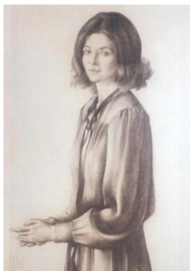
Título: Retrato de la artista Técnica: Dibujo