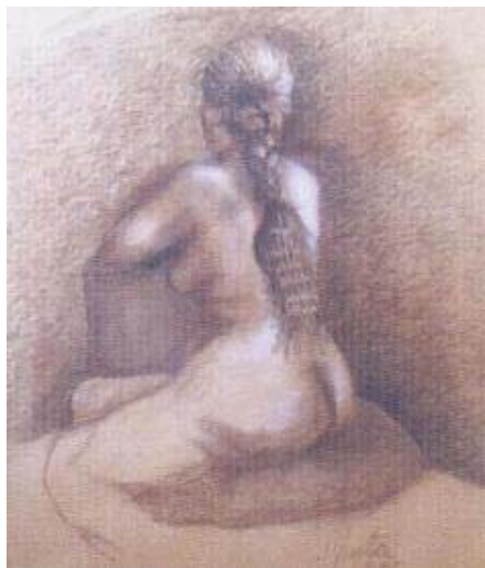
Título: Estudio de figura humana Técnica: Dibujo (Cepia)