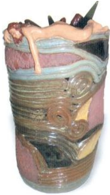
Título: Vaso y Figura Técnica: Cerámica (rodete)