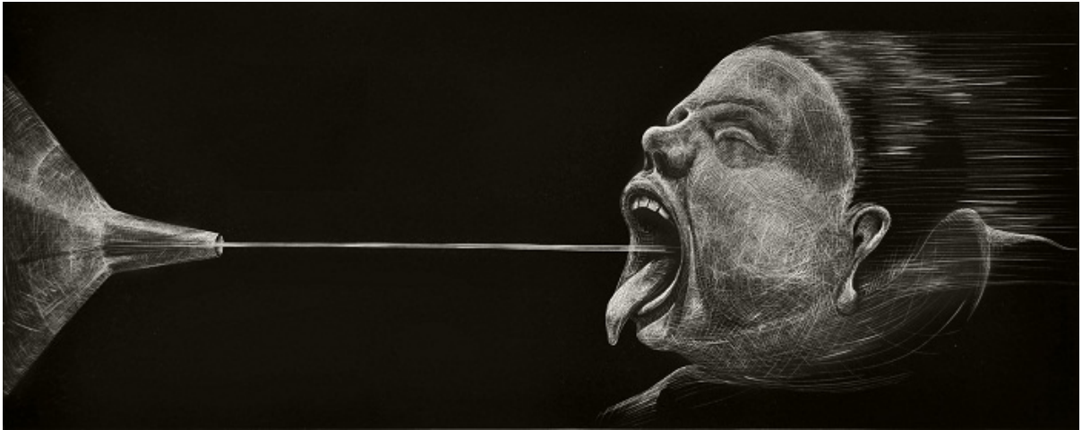
Línea de pensamiento, una xilografía de Cristóbal Farmache