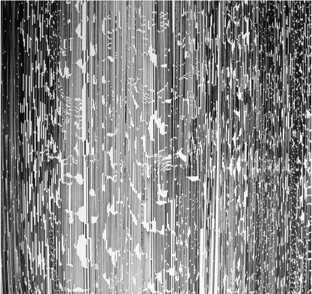
Obra de Martín Villalonga, Universos