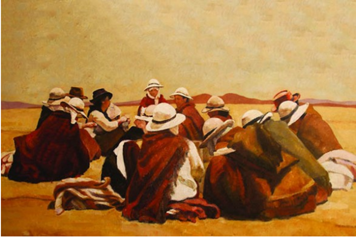
Oleo sobre mujeres del valle