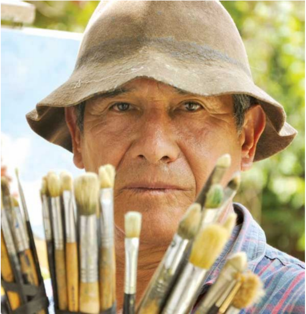
En un típico día de trabajo en su casa de Quillacollo.