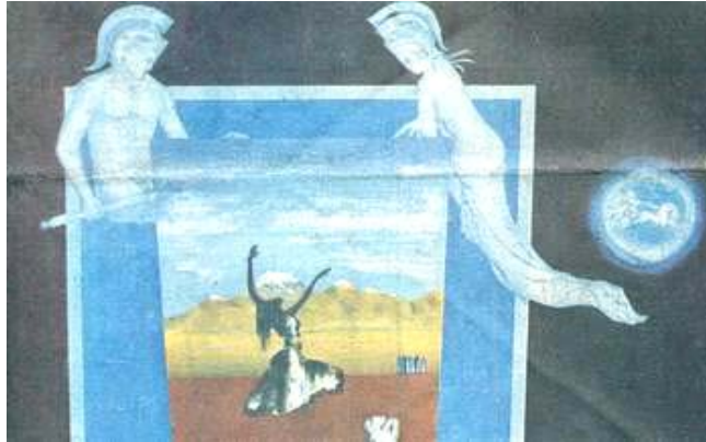
"Prometheida II": "Psiquis clama ante los dioses Apolo, Palas Atenas v Ares". El coro de las Océánides e Iris.