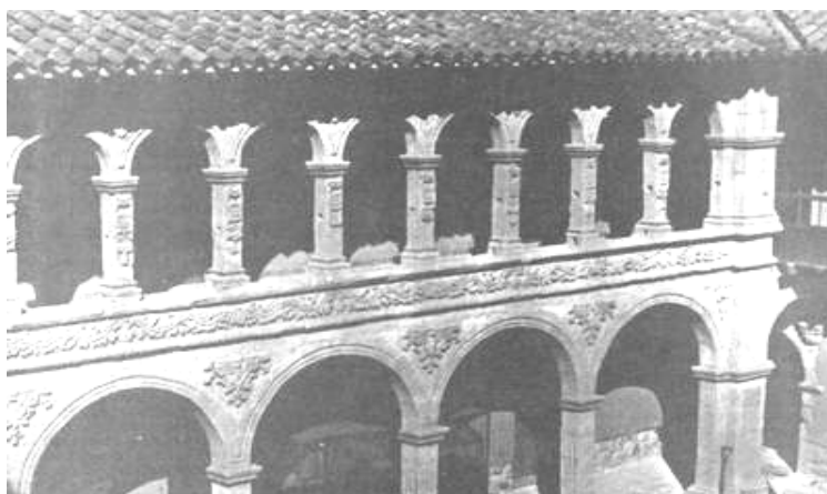
El Tambo Quirquincho, la vieja casona que ha sido restaurada, constituyendo un viejo recuerdo de la época colonial.

Y verla es no verla a un tiempo, volver a poseerla, perderla en mudanzas repentinas, reencontrarla en violentos accesos aprehensivos.