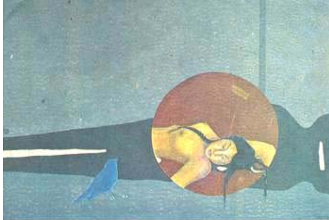
"Prometheida III". Oh, Prometeo, Pro..." La sombra del titán se proyecta junto al Ruiseñor invisible, Melifrón.

Aquí el artista se escapa a la seducción de la Hélade y transfiere el suceso al escenario altiplánico: Psiquis pasa a ser una ñusta incaica o una vestal aimara, cuyo rostro está tratado al estilo enigmático de Guzmán de Rojas. Psiquis, muere por amor — ¿la poesía, la imaginación? — y la sombra de titán se proyecta también en la obra plástica, entornando y magnificando la muerte de la bella oceánide andina.