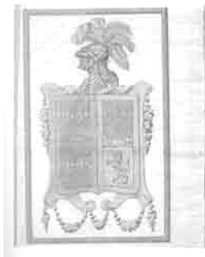
ESCUDO DE ARMAS DE LOS FERNÁNDEZ-ALONZO